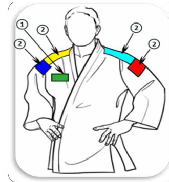
Picture 6 - Location of the advertising